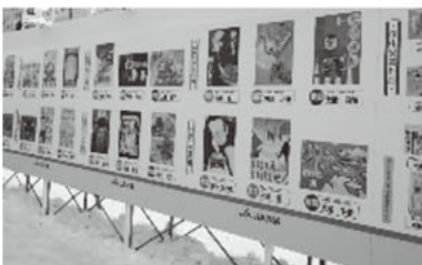
↑ 昨年の会場の様子

2月5日から12日まで開催 される「第69回さっぽろ雪まつ り」7丁目会場にて、平成29年 度J A共済全道小・中学生交 通安全ポスターコンクールの 入賞作品65点を展示します。 J AとJ A共済連北海道は 交通ルールの大切さや交通安 全に対する願いが描かれた 小・中学生の皆さんの作品を 通じて、交通事故防止の意識 づくりにつなげたいと考えて います。