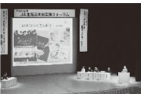
↑J Aによる事例発表の様子

昨年11 月21日に 札幌市で 開催した 「J A北海 道大会実 践フォー ラム」では、J A北海道大会 (平成27年開催)の決議事項の 実践機運を高めること等を目 的に、「新規担い手倍増」と「道 民と食と農でつながるサポー ター550万人づくりと准組 合員制度」をテーマに取り上 げ、J Aの実践事例発表とパ