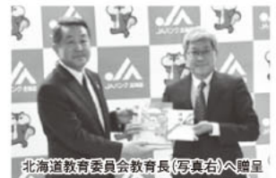
北海道教育委員会教育長(写真右)へ贈呈

農教育等を テーマとし た教材本を 製作し、J Aを通じて 道内の小学 校へ贈呈し ています。