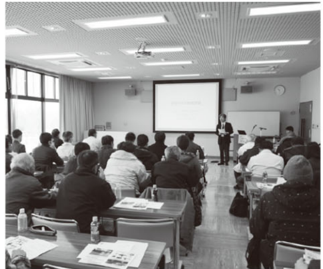
説明を真剣に聞く参加者

その後、J A伊達市穀類等乾燥調製施設前にてGPSトラクターと最新の自動航行ドローン