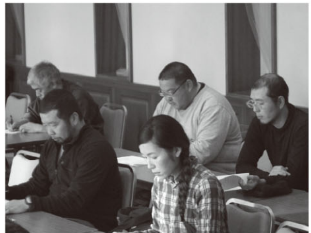
イチゴ部会総会の様子