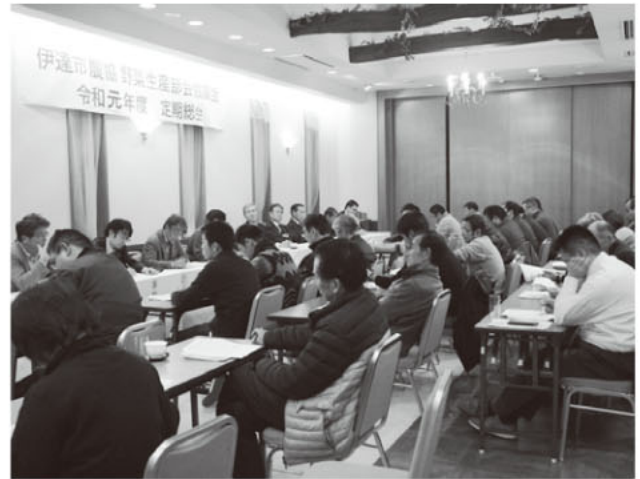
野菜生産部会協議会総会の様子

異常気象が続く日本で品質・収量の低下を最小限するための栽培講習会や先進地視察に取り組みしており、地産地消の拡大や消費者のニ