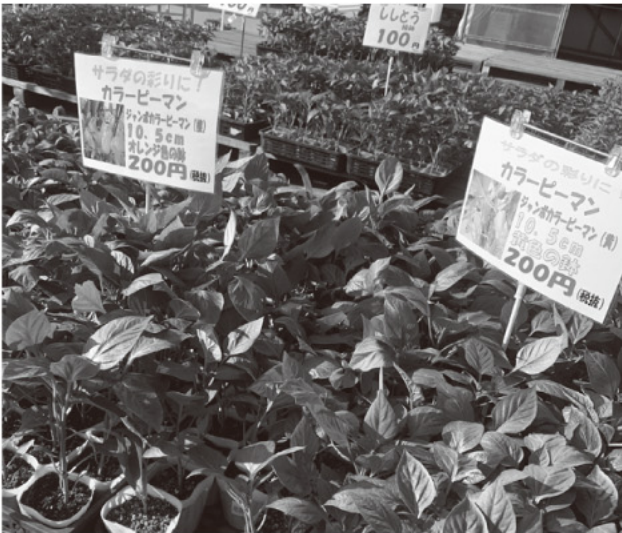
彩り豊かカラーピーマン