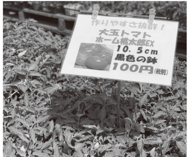
大好評大玉トマト