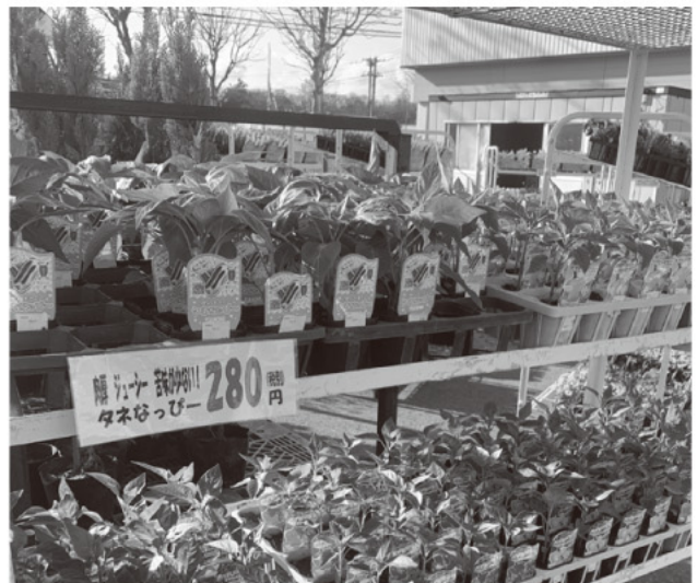
種がないピーマン