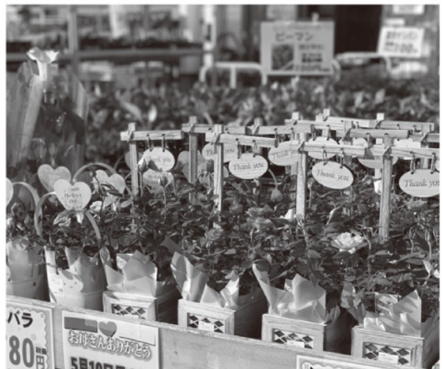
母の日用ミニバラ