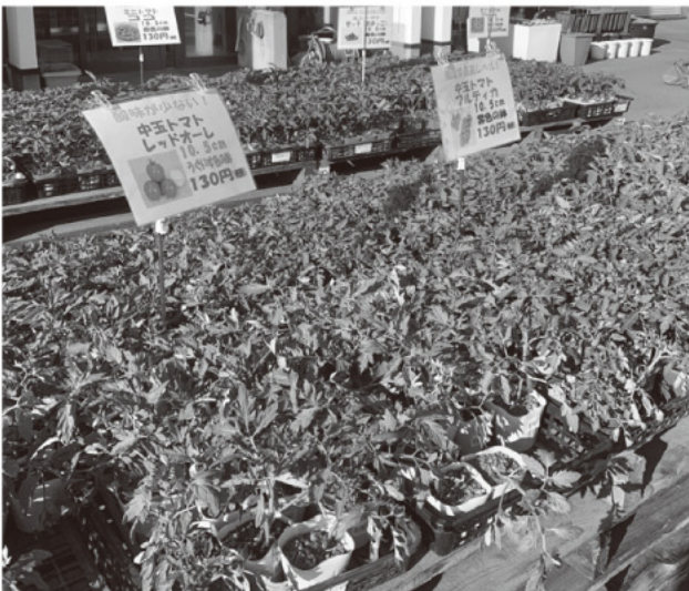
意外と人気中玉トマト