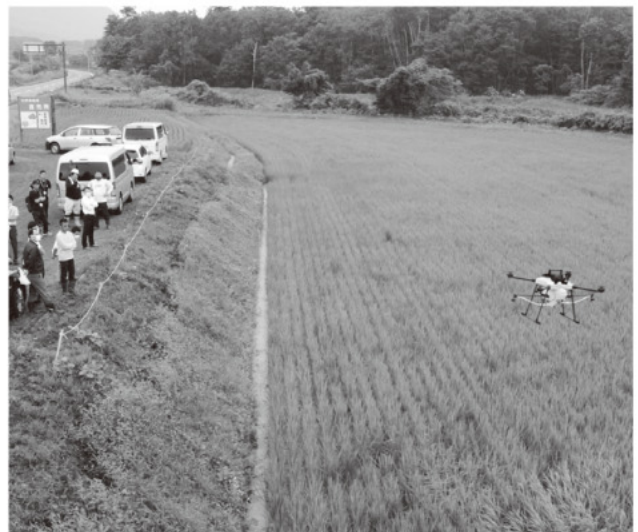
散布試験のようす

最新モデルのエンルート製「AC101」及びDJI製「T20」を使用した散布試験は15分~30分程度で散布が完了し、散布スピードの速さと自動航行の利便性を体感しました。スマート農業に係るお問い合わせは営農指導課までお願いします。