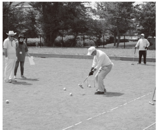
元気よくプレーするようす