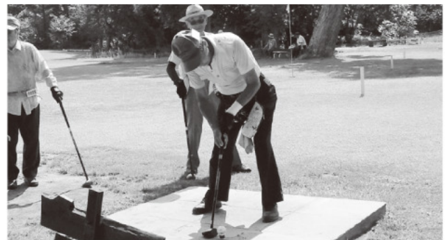
ハツラツとプレーするようす