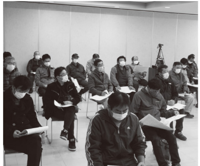
農事組合長会議のようす