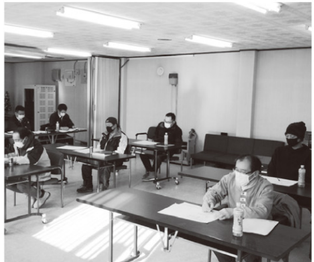
登別地区の懇談会のようす

感染症対策として換気や消毒などを徹底し実施しました。組合員の皆さんとの意見交換の場として、JAに対する意見や質問、今後の方針など多くの組合員の皆さんから寄せられました。貴重な意見として受け止め、企画、改善をしていく方針です。また、質疑応答についての詳しい内容は来月号でお知らせします。