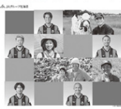
コンサが食と農を応援する。

令和3年度の北海道コンサドーレ札幌との連携活動は、アグリアクション北海道の取り組みとして位置づけ、実施してまいります。