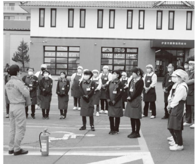
消火器の説明を聞く職員

西胆振行政事務組合伊達消防署の協力のもと避難についての情報や火災事例、消火器を使用した消火訓練を行いました。パート従業員も含めた職員36名が真剣に取り組み、地域に根差した店舗運営に向け、安全意識の向上ともしもの災害への対応力を養います。