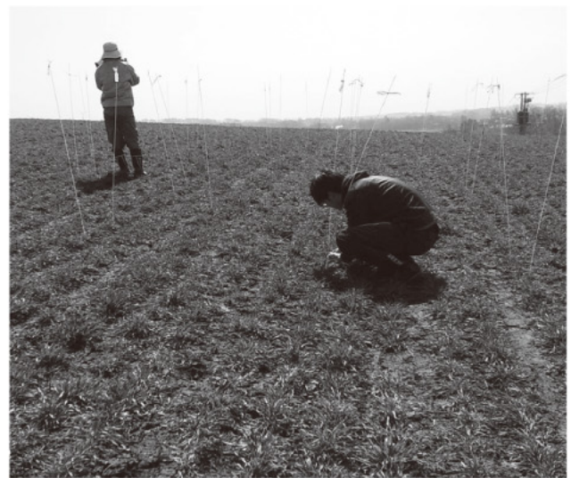
試験区設置のようす

伊達市のゆめちからは、収量・品質においては更なる向上が見込めます。そのため、試験結果次第では栽培管理における有用な方法として期待できます。