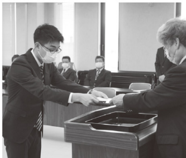
辞令交付のようす

また、新たな職員を迎え役職員も初心に戻り 新たな気持ちで業務に努めてまいります。