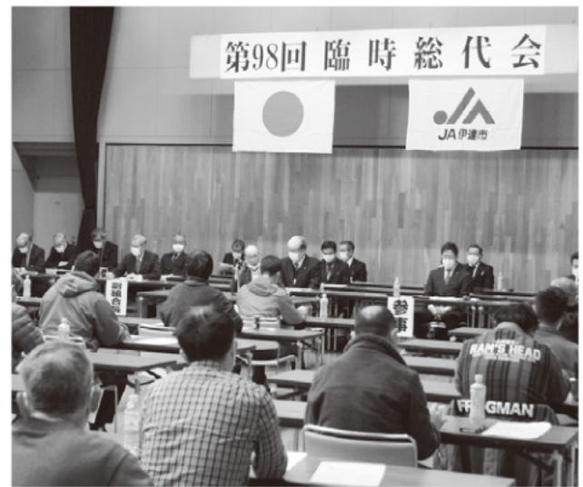
臨時総代会のようす

伊達野菜ブランドの中心的野菜であるトマトは平成20年に「藤五郎」としてブランドネーム化し、伊達市担い手育成センターでは、新規就農者の研修プログラムの主軸としてトマトが位置付けられています。今後はトマト部会員を中心にトマトの生産量増加に向け推進し、農家所得、収益の向上を図っていきます。