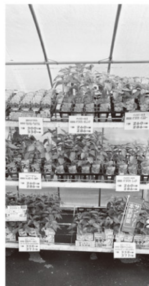
企業の商品も充実