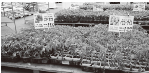
人気商品ミニトマト