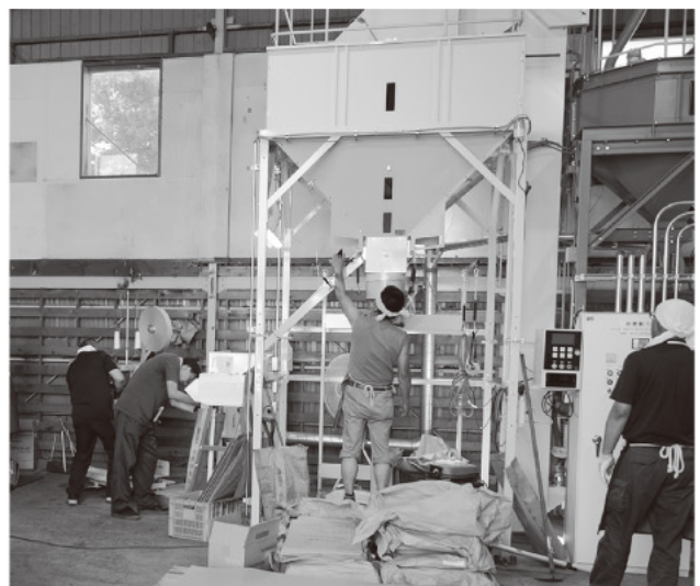
消毒作業のようす

種子小麦の消毒作業は9月上旬にも行われ、JAと生産者が一丸となって高品質化に取り組んでまいります。