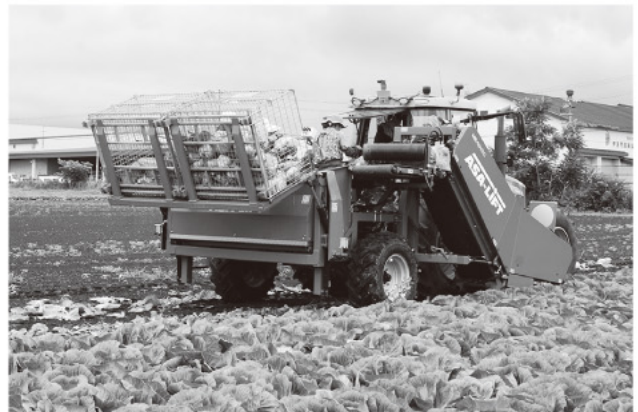
デモンストレーションのようす

実際に乗って作業にあたった稼働者は、「腰を曲げずに作業できるのがとても楽だ」と期待を寄せていました。