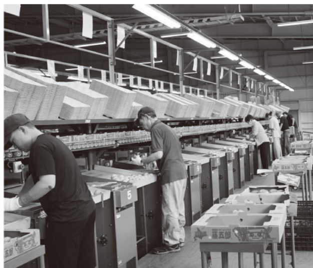
トマトの選果の様子