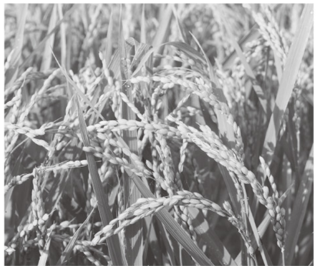
平年より早い生育の水稲

また、今年もドローンでの防除によるスマート農業の拡大が進んでいます。ドローンでの防除は作業時間の短縮や気象状況に応じた適期防除に努めることができますので、興味のある方は生産資材課へお問い合わせください。