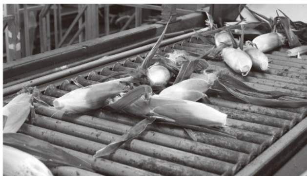
出荷されたスイートコーン

また、生食用スイートコーンの作付面積は27.4ha。栽培品種は「恵味」や「ハーモニーショコラ」が中心で、出荷は例年より早い7月中旬から開始されました。天候にも恵まれ気温も高かったことから例年より早くピークを迎え、収量においても年間500トンと昨年より1割ほど増加する見込みです。