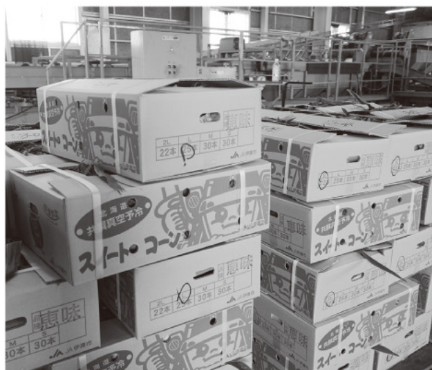
箱詰めされたスイートコーン